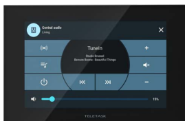
L'audio à portée de main

COMMANDE CENTRALE DE TOUTES LES FONCTIONS DE BASE