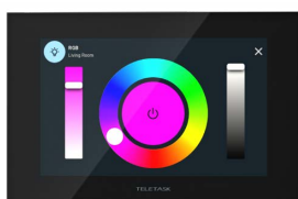
Contrôle des lumières RVB