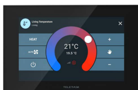
Contrôle de la température

Le PENTUS-écran dispose d'un système de menu couvrant toutes les pièces, avec leurs commandes individuelles et de groupe. Par exemple, il permet de contrôler l'éclairage, les températures des pièces, les rideaux et les stores, l'audio, les fonctions de gestion de l'énergie, etc. PENTUS est conçu pour une utilisation dans les pièces et les endroits où vous souhaitez avoir une vue d'ensemble centralisée de toute la maison/le bâtiment et contrôler les fonctions intégrées d'une simple pression du doigt.