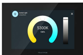
Blanc accordable et plus encore...